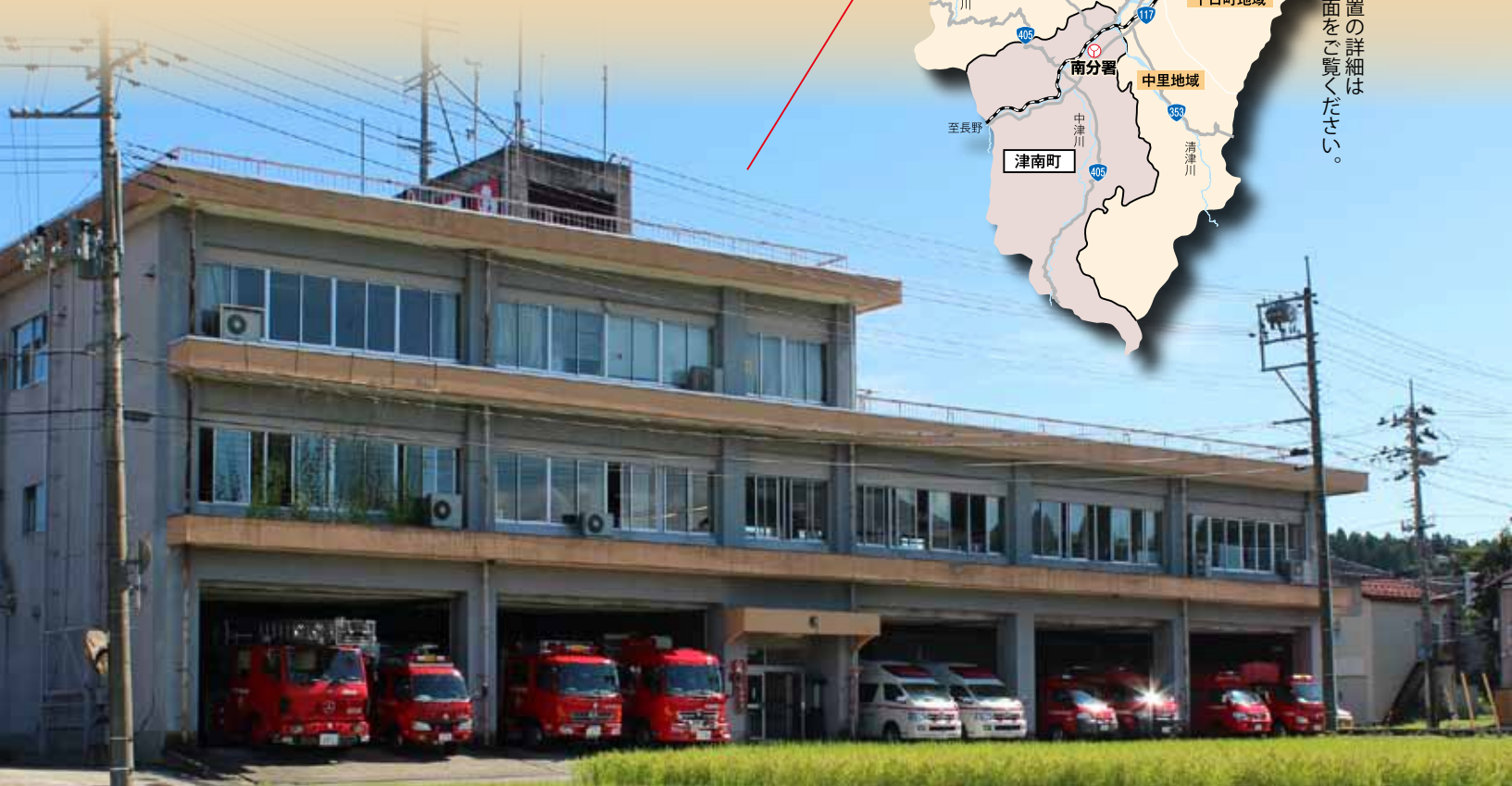
現消防本部庁舎（十日町市 川治内後第2）