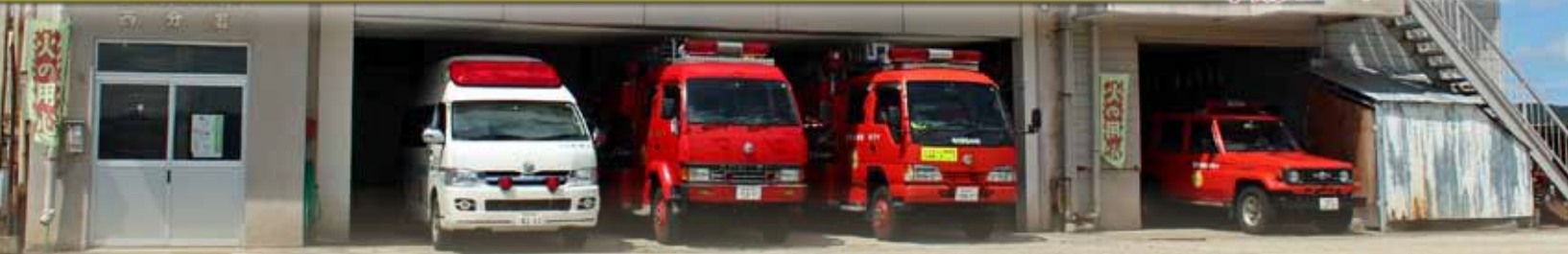
現西分署庁舎（十日町市 霜条）